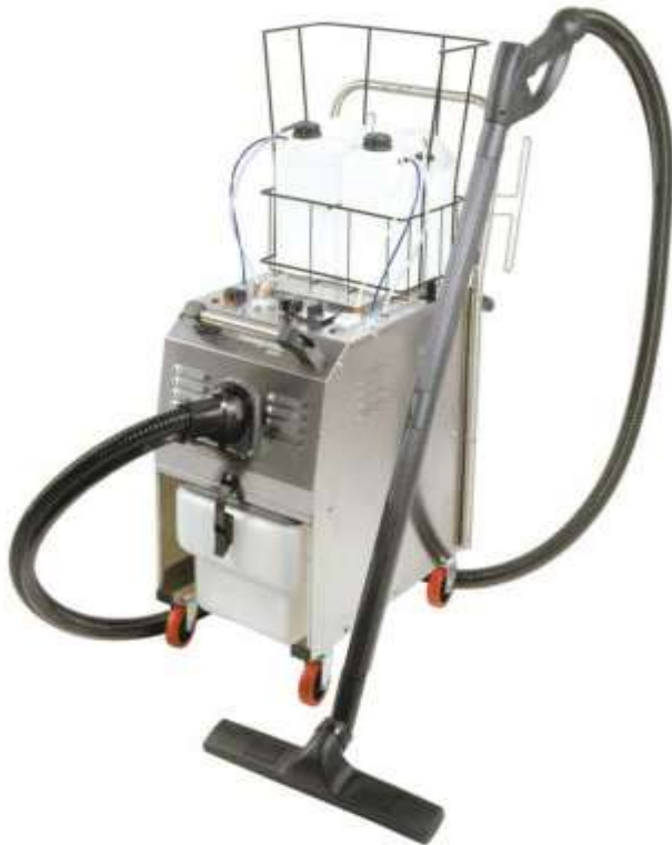
Mondial Vap 7000 Inox

✓ LIMPIEZA EN PROFUNDIDAD (PERIODICIDAD MENSUAL): La Mondial Vap permitirá limpiar a vapor la unidad manera profunda y rápida.